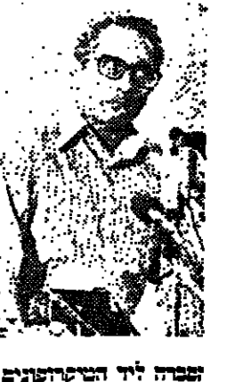
השר לביטחון המזון, ד"ר יצחק רבין

הממשלה הנחה את השר לביטחון המזון, ד"ר יצחק רבין, להחליט על התנגדות ישראל להקמת כור גרעיני במצרים. רבין הודיע כי ישראל תתנגד להקמת הכור, אך לא תתנגד להקמת מתקני חשמל גרעיני. רבין הודיע גם כי ישראל תתנגד להקמת מתקני חשמל גרעיני במצרים, אך לא תתנגד להקמת מתקני חשמל גרעיני בישראל.